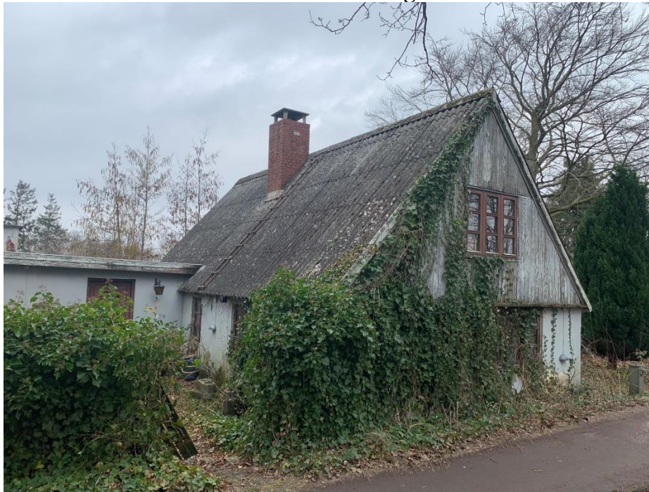
Røstoftevej 11, 4735 Mern

Murstenshus med tag af fibercement herunder asbest fra 1900 på 120 m 2 jf. BBR. Grunden til ejendommen er jf. BBR 703 m 2 , hvorpå der også ligger en carport, der jf. BBR er 15 m 2 .